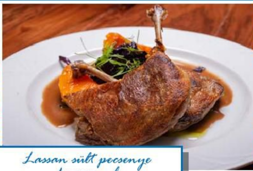
Lassan sült pacsenye kacsacomb