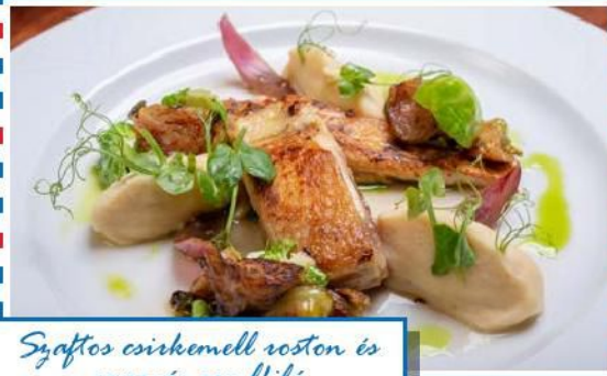
Száftos csirkemell rostón és ropogós combfilé