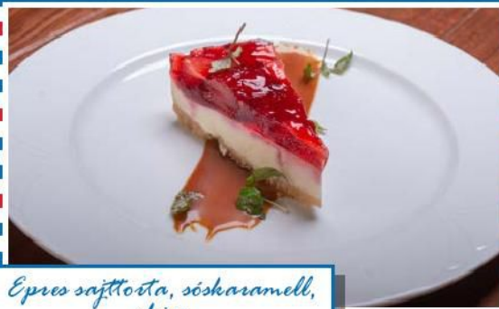
Epres sajtorta, sóskaramell, shizo