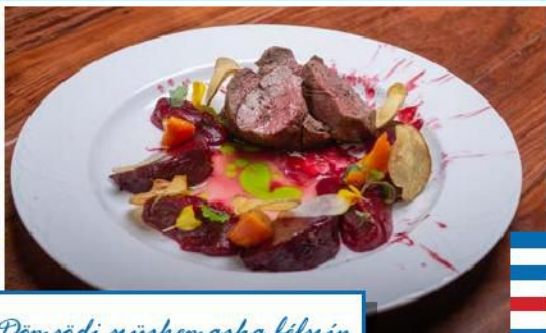
Dömsödi szinkemarha béiszin